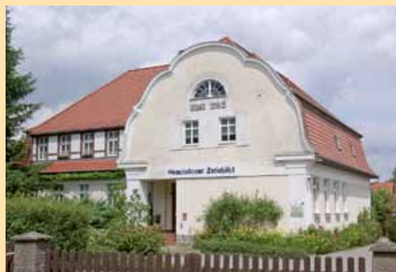
Ehemalige Schule – derzeitiges Verwaltungsgebäude – zukünftige Kita?

Weitere Informationen zu diesen und anderen Themen in der Gemeinde siehe hier: https://www.dielinke-oder-spre.de/ortsverbaende/steinhoefel/aktuell/nachrichten/