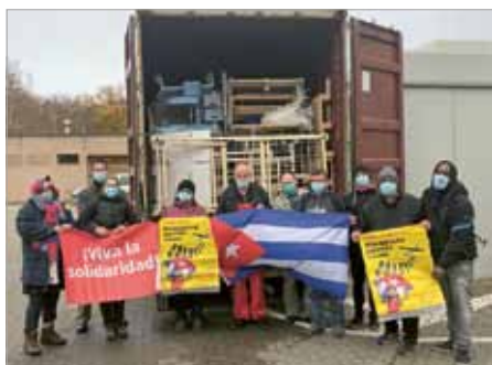
21. 11. 2020, Haldensleben: Der 40-Fuß-Container mit Krankenhausbetten, Verbands- und Verbrauchsmaterial, Material für chirurgische Eingriffe u.a. ist gepackt und bald in Kuba.

Das kubanische Gesundheitswesen ist hervorragend. Es setzt auf Prävention, Aufklärung, Impfung und flächendeckende Versorgung mit medizinischem Personal bis in die entlegensten Orte. Doch es ist nicht unverwundbar. Die während der Pandemie verschärften Sanktionen der US-Blockade erschweren den Kauf dringend benötigter Verbrauchsmaterialien und Geräte.