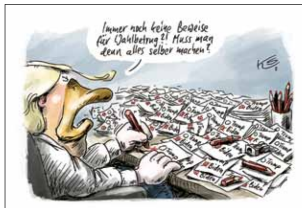
Zeichnung: Klaus Stuttmann