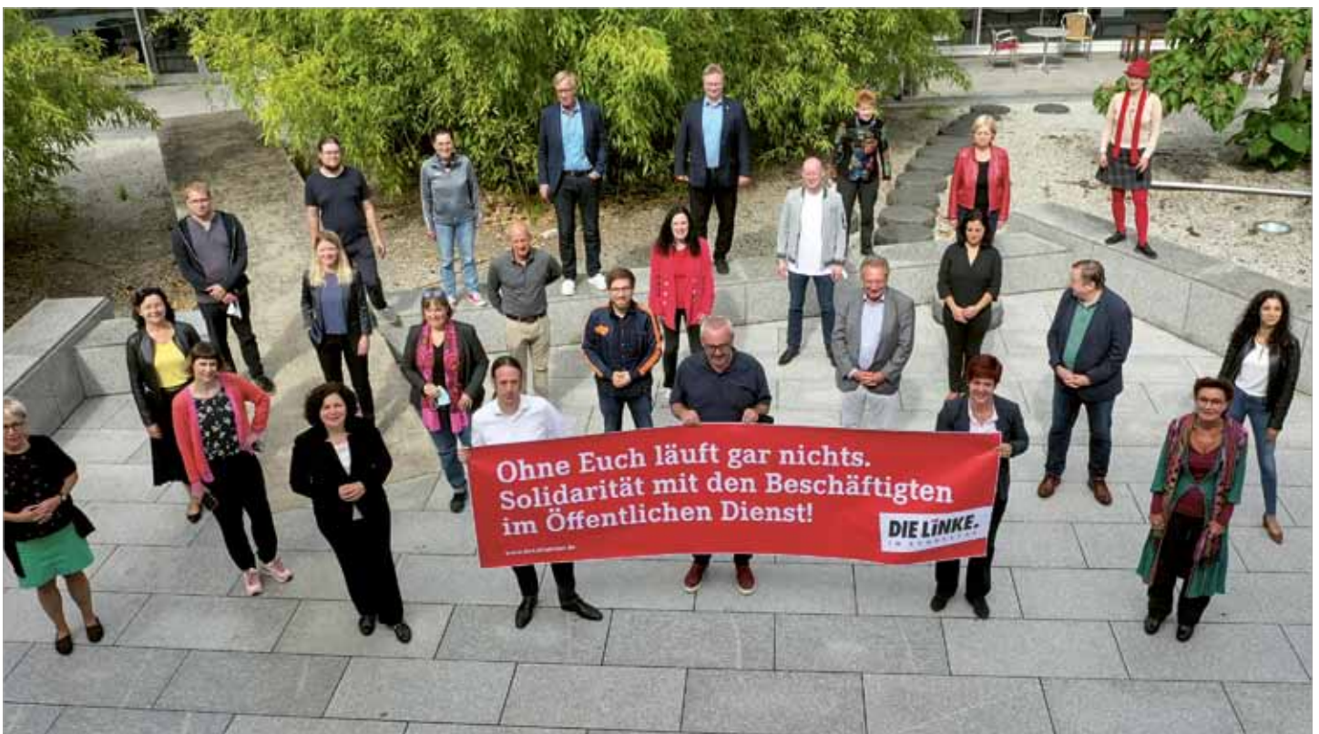
Auf ihrer Klausurtagung in Potsdam vom 2. bis 4. September 2020 unterstützen Abgeordnete der Fraktion DIE LINKE die Forderungen der Beschäftigten im öffentlichen Dienst.

Verkäuferinnen und Verkäufer in deutschen Supermärkten haben 2020 im Schnitt weniger verdient als im Vorjahr. Das geht aus Zahlen des Statistischen Bundesamtes hervor.